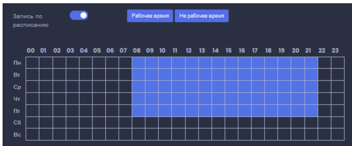
Рисунок 4. Настройка интервалов времени для записи

Настройка рабочего времени и дней видеонаблюдения производится нажатием на необходимые клетки. Также можно выбрать вести запись в рабочее время или в не рабочее время.